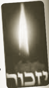
"נר ה' נשמת אדם"