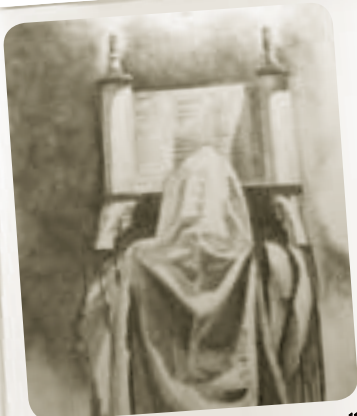
"והיא שעמדה לאבותינו ולנו..."